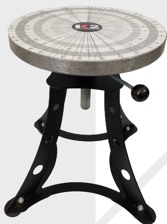
Base em Alumínio

Além disso, o Banco Duo oferece a possibilidade de utilizar sua base como um torno manual, ideal para a modelagem ou pintura das peças. Com o gabarito divisor de 2 a 15 posições, você terá mais precisão e facilidade no processo.