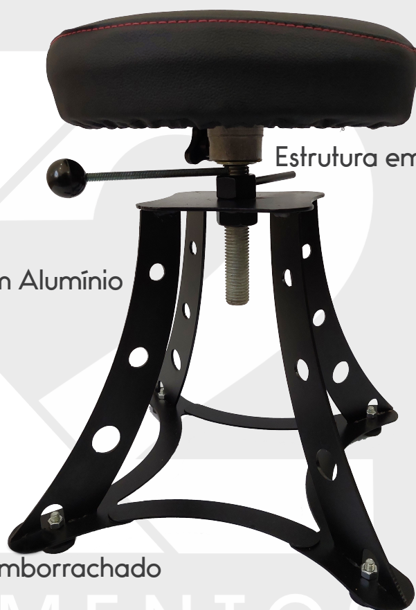
Estrutura em Aço